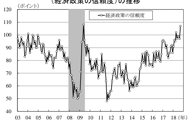
第3図: ミシガン大学消費者センチメント (経済政策の信頼度)の推移